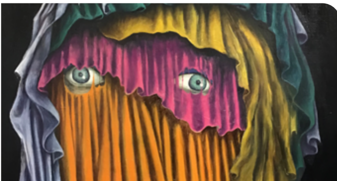
© Judith Lano - Exposition « Un nouvel Eden ? »

À 11h, les samedis 17 juillet, 24 juillet, 31 juillet, 7 août, 21 août, les mercredis 21 juillet, 28 juillet, 4 août, 11 août, 18 août et le dimanche 15 août (durée : 1h15) Rdv au Musée archéologique départemental