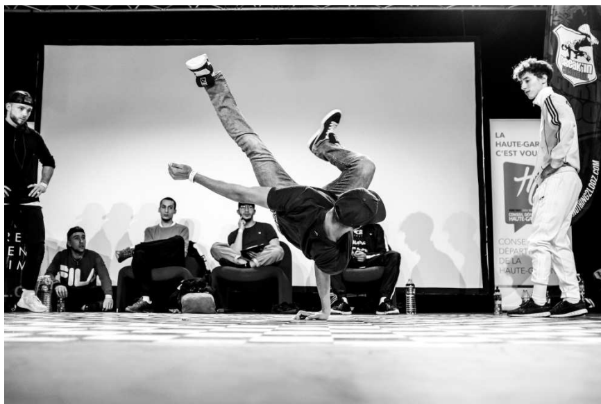
La Semaine des cultures urbaines 2018 – Hôtel du Département

> Vernissage le mercredi 19 juin à 19h30